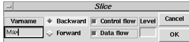
図8 スライス選択画面 Fig. 8 Select window.