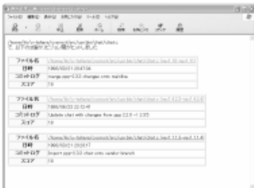
図 4: 検索結果のファイル別一覧