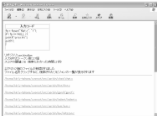
図 3: 検索ファイル名一覧